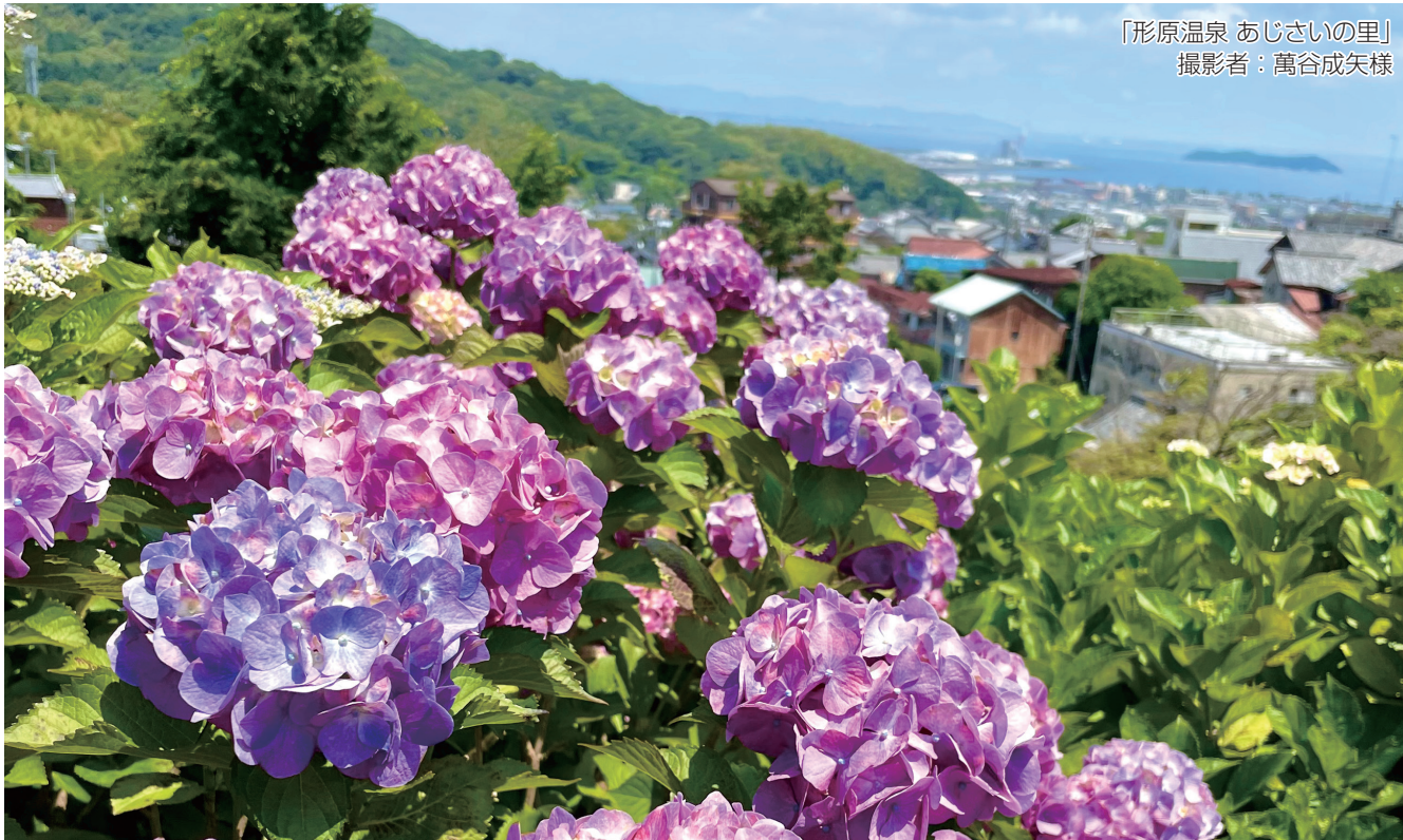
「形原温泉 あじさいの里」